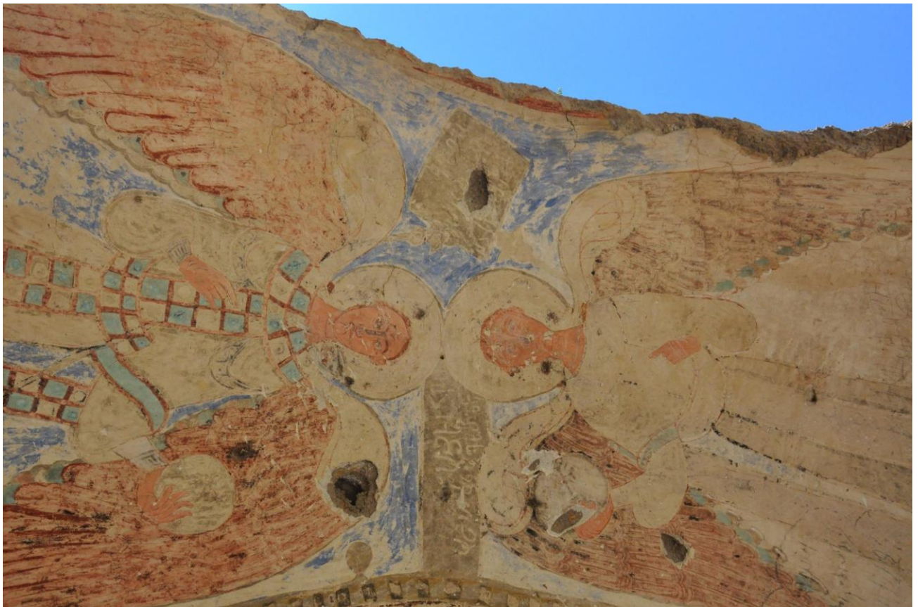
2016 թ., այս և հաջորդ լուսանկարները Բրբահիմ Սուլեյմանօղլուի:

Տապանատան արձանագրության մեջ Ջաքարեի անվան հիշատակությունը թույլ է տալիս որոշելու դրա, ուստի նաև որմնանկարի ստեղծման ժամանակը: Հայտնի է, որ Անին Շաղդադյան վերջին ամիրա Սուլթանի մահից հետո Ջաքարյաններին է անցել 1198 թ. վերջերից, իսկ մահացել է Ջաքարիա ամիրայասալարը 1212 թվականին: Հետևաբար, Տիգրան Հոնենցի տապանատան որմնանկարը նկարվել ու նրա վրայի արձանագրությունը գրվել է հենց այս թվականների միջակայքում: