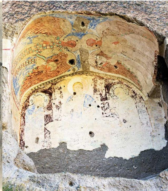
2015 թ., լուսանկարը Հրայր Բազեի: