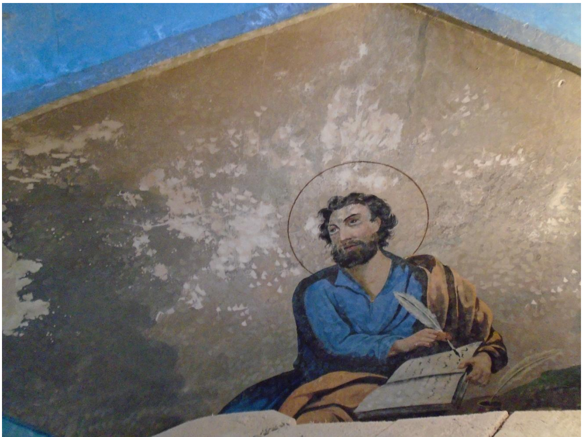
Մարկոս ավետարանիչ (վերականգնումից առաջ և հետո): Mark the Evangelist (before and after restoration).