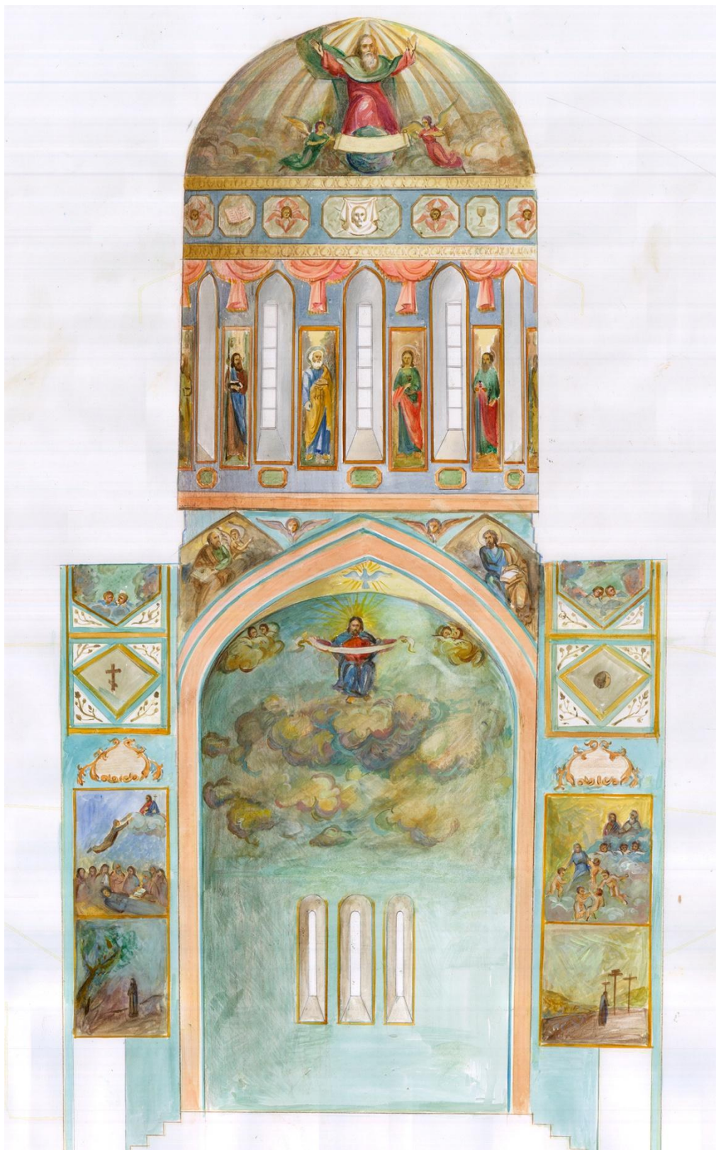
Արևելյան պատի կտրվածքը (զճանկարը վրականգնողական խմբի): A section from the East wall (drawing by the restoration group).