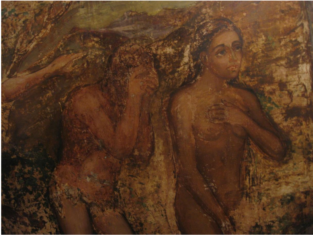
Ադամ և Եվա: Adam and Eve.