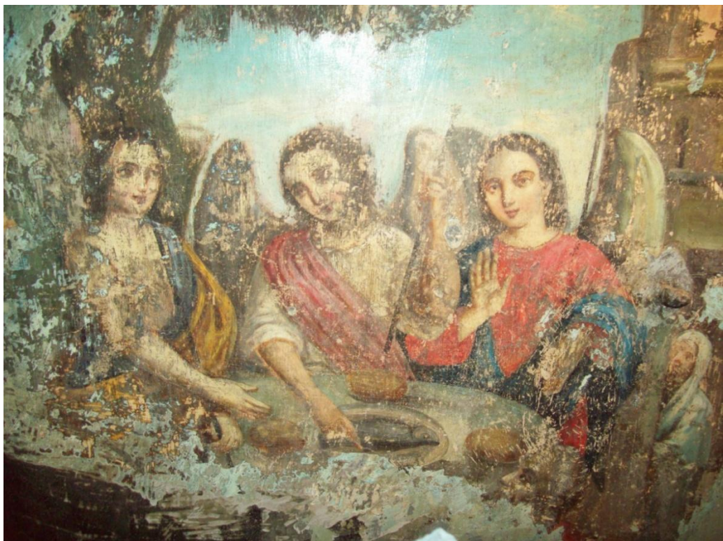
Երեք հրեշտակ: Three Angels.