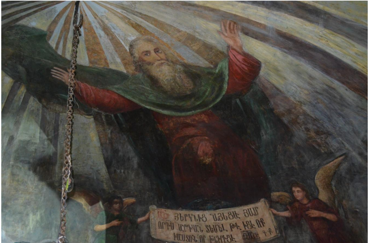
Հայր Աստված: God the Father.