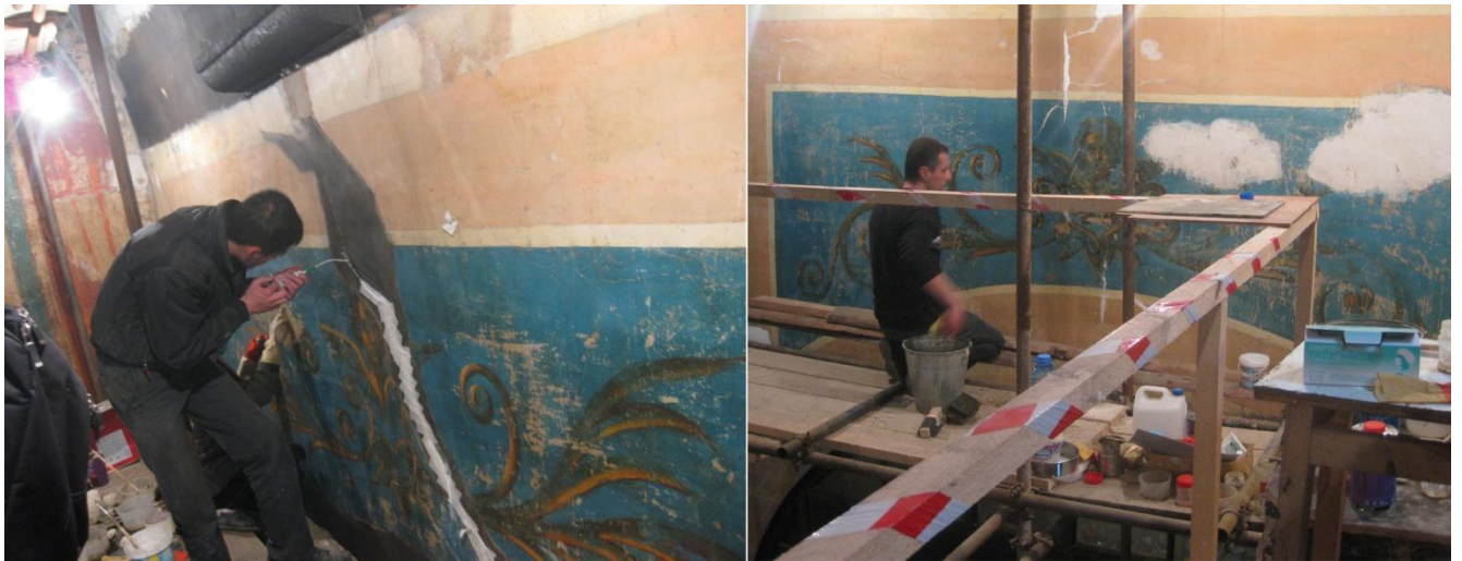
Աշխատանքային դրվագներ: Work in progress.