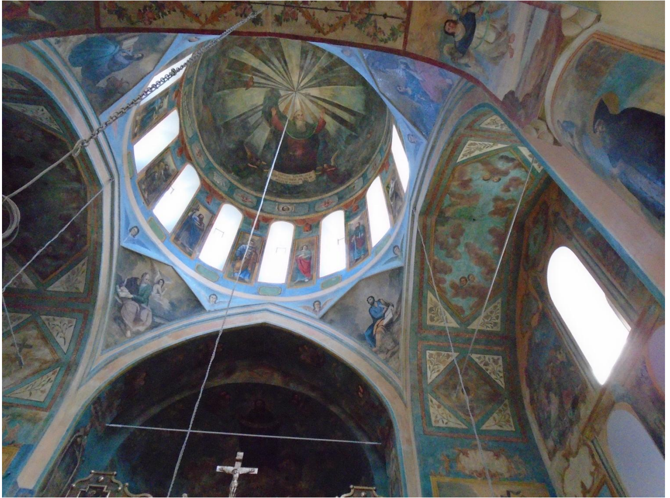
Գմբեթի ներքը: Inside the dome.