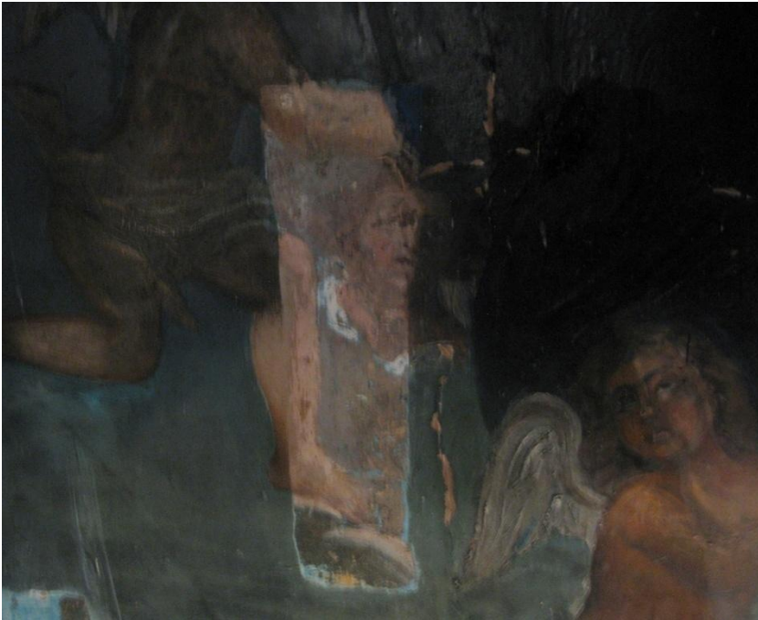
Մաքրման և վերակազմման աշխատանք: Cleaning and restoring.