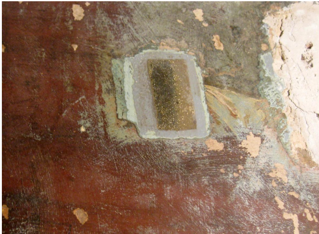
Որմնանկարի շերտերը փաստագրող հատված: Conservation documentation section.