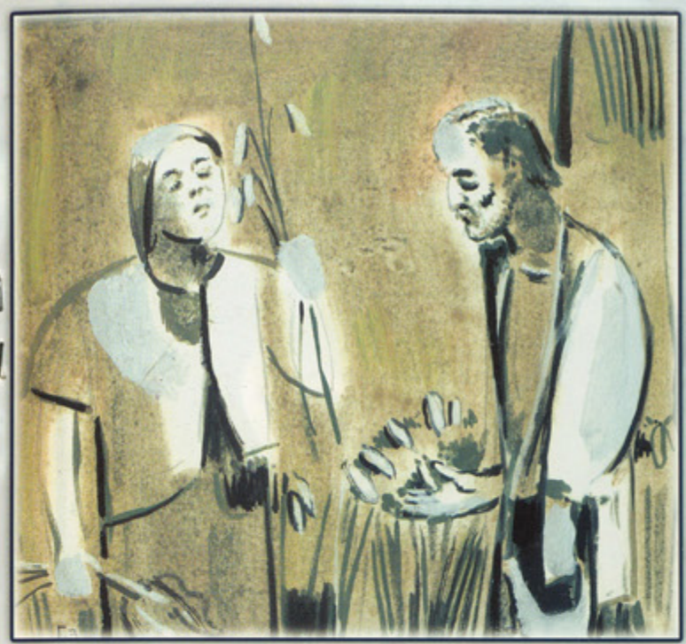
Ցրեմի արտի եզրին